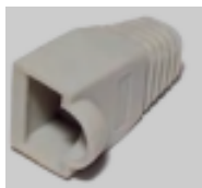
Taivutussuoja (näitä on eri väreissä)