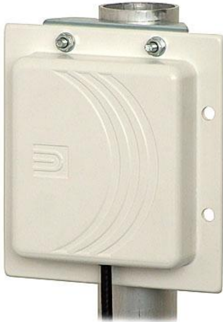
Pystypolarisaatio (normaali WLAN)