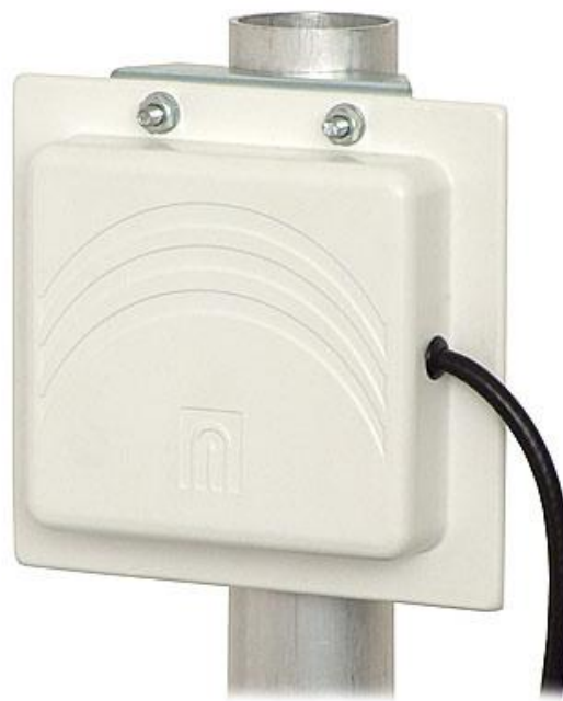
Vaakapolarisaatio (vastapään antennin pitää olla samassa asennossa)